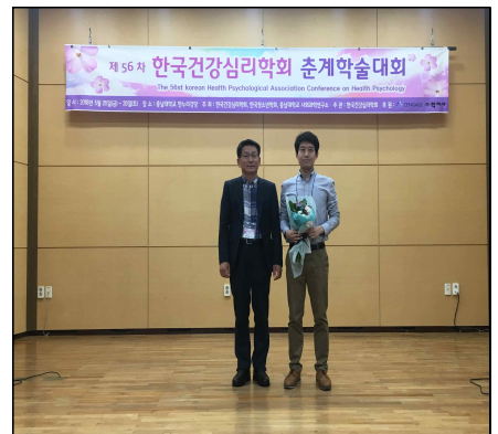
▲ 한국건강심리학회 제 56차 춘계학술대회 사진