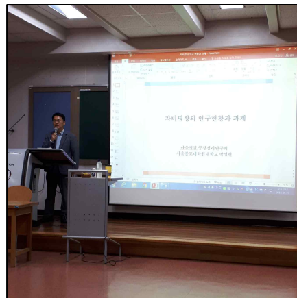
▲ 마음챙김-긍정심리연구회 18년 5월 월례회 사진