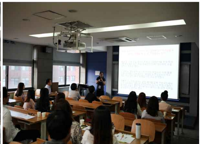
▲ 남동부지회 제9차 학술대회 현장 모습