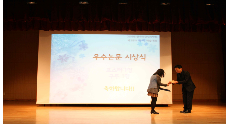
▲ 한국건강심리학회 제 53차 동계학술대회 사진