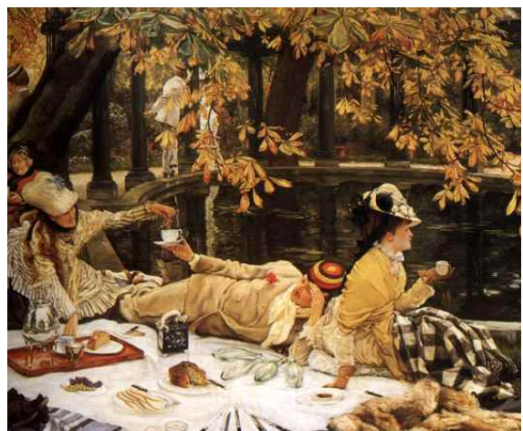
'Holiday(The Picnic)' Jacques Joseph Tissot (1836 - 1902) Oil on canvas, circa 1876