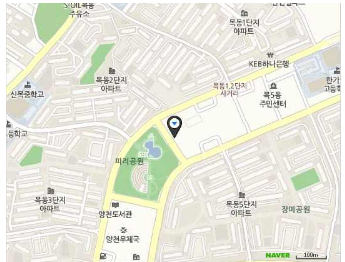
▲ 선 심리상담센터 찾아오는 길