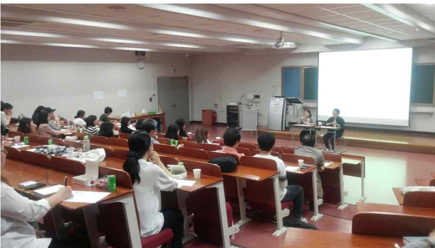
▲ 9월 월례회 현장 모습