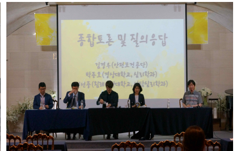
▲ 2017 건강심리학회 제 54차 춘계학술대회 사진