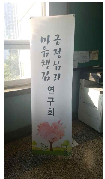
▲ 마음챙김-긍정심리연구회 17년 6월 월례회 사진